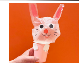
かんたんおもちゃを作ろう!