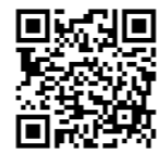
どんぐりサークル 申込フォーム

転勤ママサークル 5月22日(水) 10:30~11:10 対象:県外出身・ 転勤族のママ