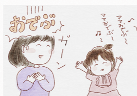
Iさん(6才・2才・4ヶ月)

2歳の時テレビで歌を聞いていた娘。いきなり歌にあわせて「ママおでふー!ママおでふー!」と歌い出しました。今までそんなこと言ったことなかったのに(泣)悲しさもありましたが面白さもとりとて笑いました。