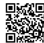
プレパパ プレママひろば 申込フォーム

どんぐりサークル 5月15日(水) 10:30~11:10 対象:1才~就学前まで