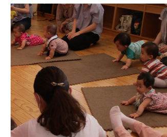
にこにこ広場 7月9日(金) 10:30~11:10 ※要予約 1才のお誕生日まで対象 (定員となり締め切りました)