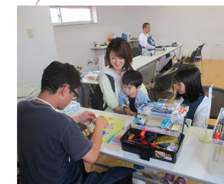
おもちゃ病院 7月18日(日) 10:00~12:00 予約不要・当日受付 はっち5Fレジデンス