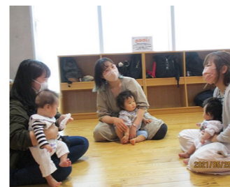
転勤ママひろば 7月6日(火) 10:30~11:10 ※要予約

入場される方は、参加者の氏名、住所、連絡先のご記入をお願いいたします。小学生以上の方はマスクと靴下の着用をお願いします。