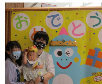
おたんじょう会 7月15日(木) 10:30~11:10 ※要予約 6月生まれ対象