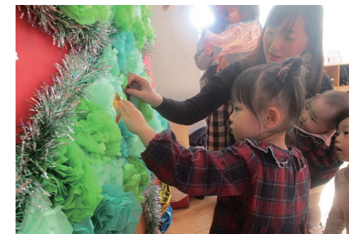
どんぐりサークル 1月29日(水) ※予約不要・当日受付