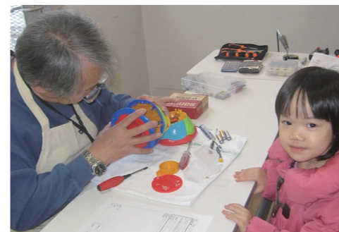
おもちゃ病院 1月19日(日) ※予約不要・当日受付