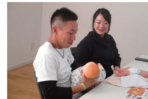
プレパパママひろば 1月26日(日) <※要予約> 随時受付