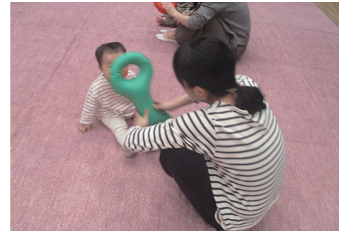
親子3B体操 1月8日(水)・1月15日(水) <※予約開始日> 8日→12/19(木)9:30~ 15日→12/25(水)9:30~

大好評につき毎月開催しているイベントです。各定番イベントの詳細は、こどもはっちまでお気軽にお問い合わせください。※予約開始日の記載があるイベントは要予約です。