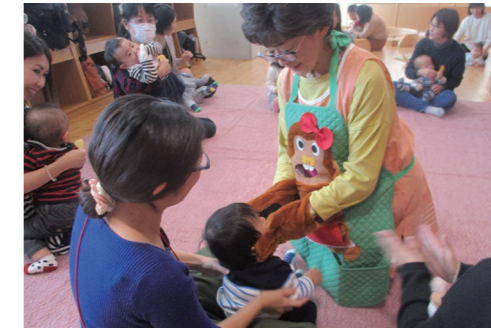
にこにこ広場 1月17日(金) <※予約開始日> 8日→12/19(木)9:30~ 15日→12/27(金)9:30~