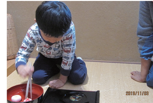
お茶会 1月19日(日) ※予約不要・当日受付