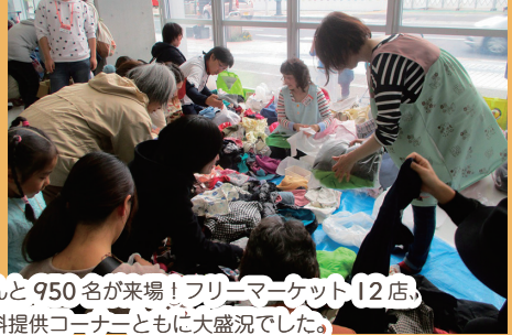
なんと950名が来場! フリーマーケット12店、 無料提供コーナーともに大盛況でした。