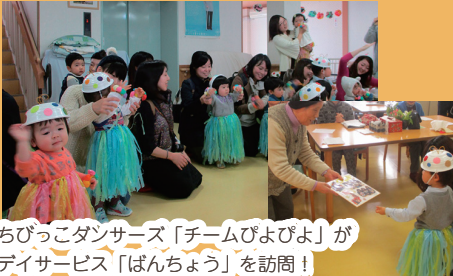
ちびっこダンス「チームぴよぴよ」が デイサービス「ぱんちょう」を訪問! かわいいキノコダンスを披露しました。