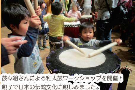
鼓々組さんによる和太鼓ワークショップを開催! 親子で日本の伝統文化に親しみました。