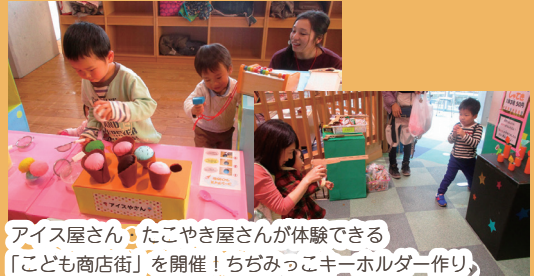
アイス屋さん・たこ焼き屋さんが体験できる 「こども商店街」を開催! ちぢみっこキーホルダー作り、 魚つり、射的であそべるコーナーも大人気でした!